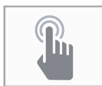
SISTEMA TOUCH ATTRAVERSO VETRO