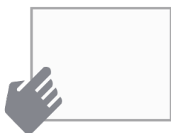
REMOVIBILE / RIUTILIZZABILE