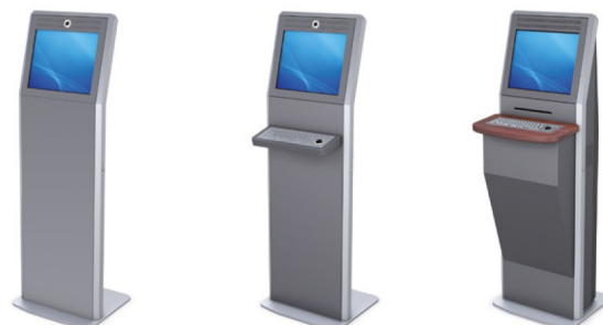
Totem ASTALON in versione base, con tastiera e con stampante laser