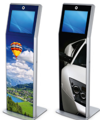
Design personalizzato tramite applicazione di grafiche adesive

ASTALON può essere utilizzato per fornire informazioni di carattere generale o di localizzazione, può avere la funzione di un POI o di un POS, può fornire informazioni sui dipendenti oppure può essere utilizzato nell'ambito di mostre commerciali o presentazioni multimediali.